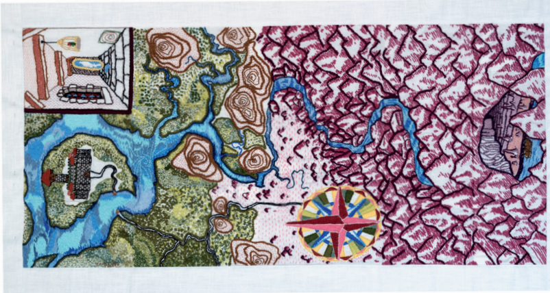
La broderie de la conquête (1x2,50 m)