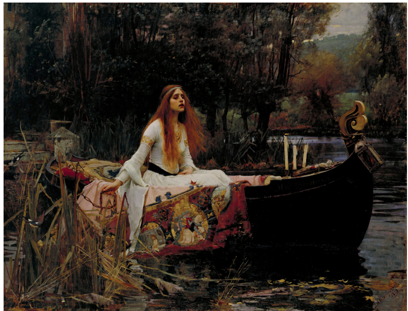
Deux sources d'inspiration : The subversive stitch, embroidery and the making of feminine , de Roszika Parker, & le tableau préraphaélite de John William Waterhouse, The Lady of Shalott .