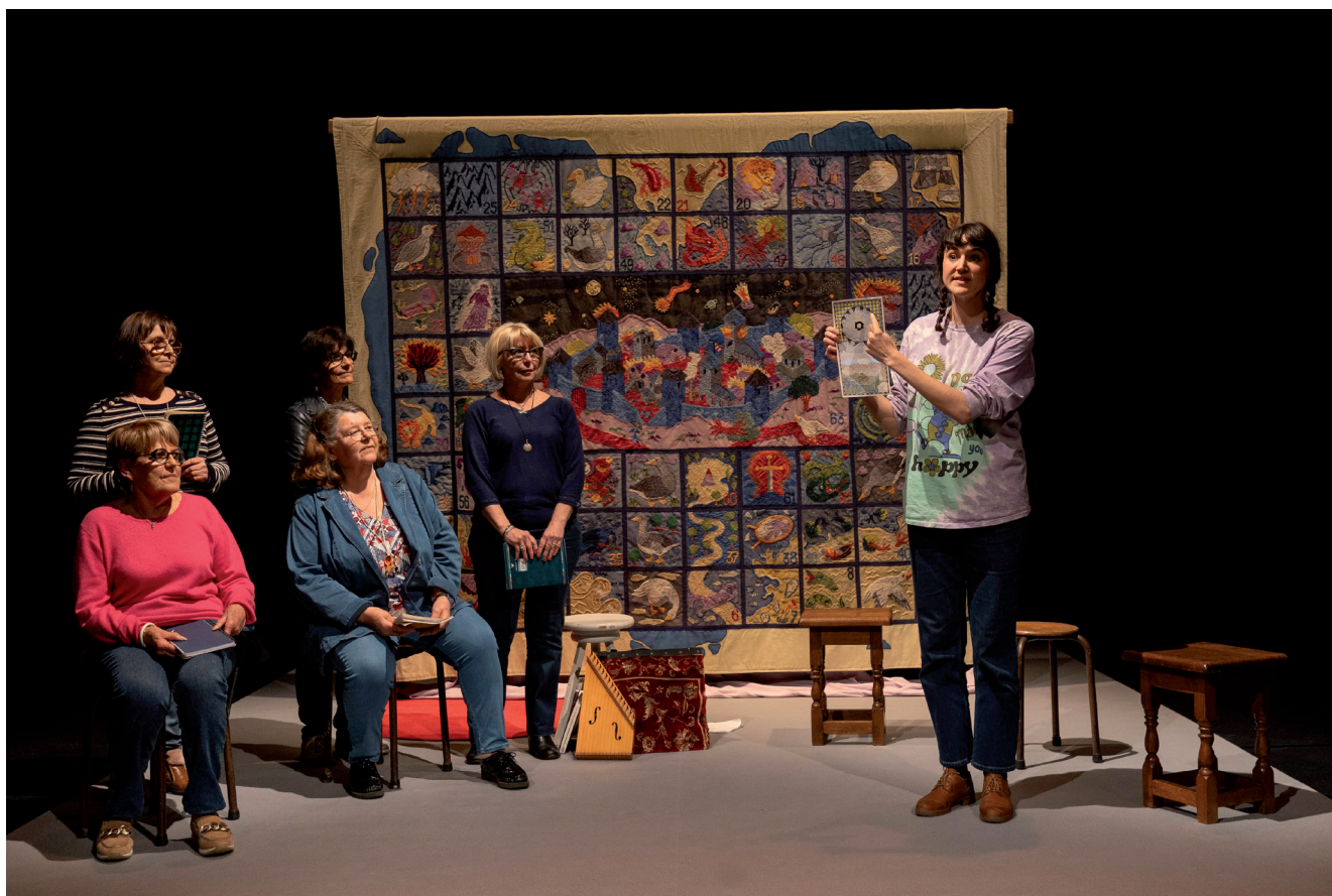
Dans Vierges maudites ! des brodeuses amatrices sont en scène pour raconter l'histoire réinventée d'Elaine.