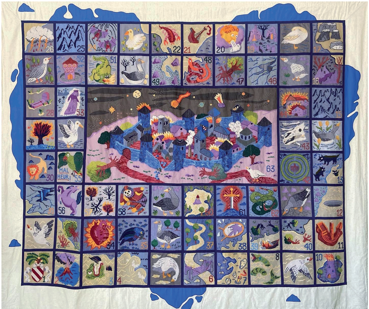
La tapisserie du Jeu de l'Oie (2,60x3,10 m)